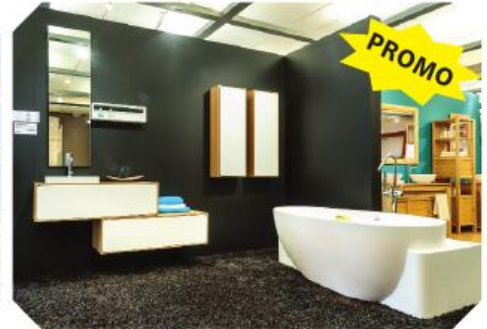
Voor spetter- en spatmomenten met de kinderen...