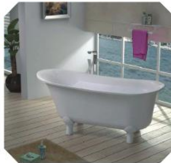
Om simpelweg verliefd op te worden!