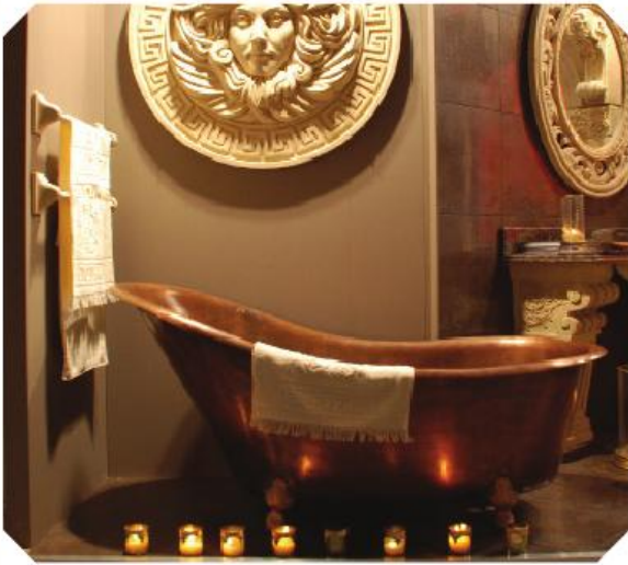
Voor zuivere wellness