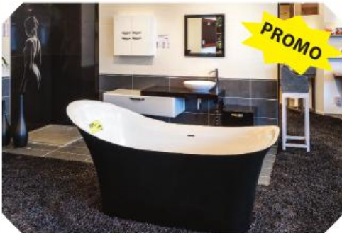
Om achterover te leunen met een goed boek en een glas wijn