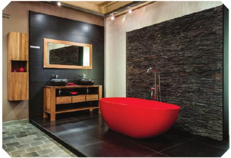
Voor romantische badmomenten